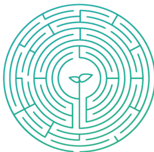
Dotace a investiční pobídky