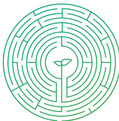
Dotace a investiční pobídky